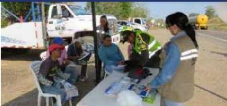
Jornada de sensibilización con conductores en el Kilómetro 68 de la ruta 2515 Puerta de Hierro - Carreto, Unidad Funcional 2