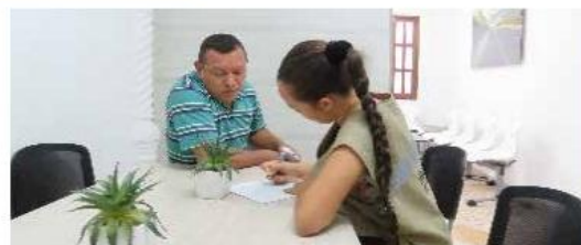
Atención a un usuario en nuestra oficina fija. Unidad Funcional 1

La Concesionaria Vial Montes de María SAS, ha dispuesto para atender a las comunidades, una oficina fija ubicada en la Calle 24 No. 52-57, en el municipio de El Carmen de Bolívar; cuenta además con dos unidades móviles de atención al usuario que se desplazan por el corredor vial para atender las solicitudes de información, reclamaciones y/o sugerencias de la comunidad, que por distancia, no pueden acceder con facilidad a nuestra oficina fija. La línea de atención es: 3174349823 y el correo electrónico: atencion.usuario@concesionariavialmontesdemaria.com .