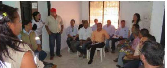
Socialización con autoridades municipales en la población de El Carmen de Bolívar. Unidad Funcional 1

En el año 2015, la Concesionaria Vial Montes de María realizó un primer ciclo de socializaciones del Proyecto con las autoridades locales de cada uno de los 11 municipios que hacen parte de nuestra área de influencia directa, con el objetivo de dar a conocer el Proyecto, sus alcances y el equipo de trabajo que lo ejecutará.