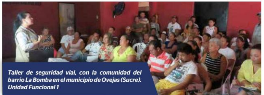
Taller de seguridad vial, con la comunidad del barrio La Bomba en el municipio de Ovejas (Sucre). Unidad Funcional 1