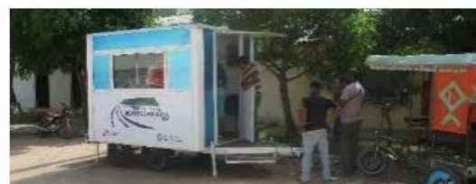
Las dos oficinas móviles se trasladan semanalmente a las diferentes unidades funcionales para atender a la comunidad.