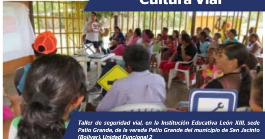
Taller de seguridad vial, en la Institución Educativa León XIII, sede Patio Grande, de la vereda Patio Grande del municipio de San Jacinto (Bolívar). Unidad Funcional 2