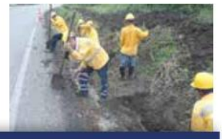
Trabajos de limpieza de obras de drenaje y cunetas