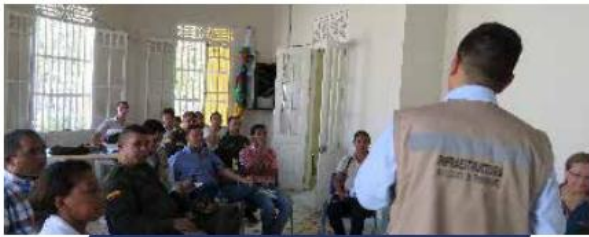
Socialización con autoridades municipales en la población de Calamar, Bolívar. Unidad Funcional 3