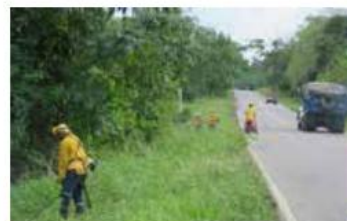
Trabajos de rocería realizados en el corredor vial