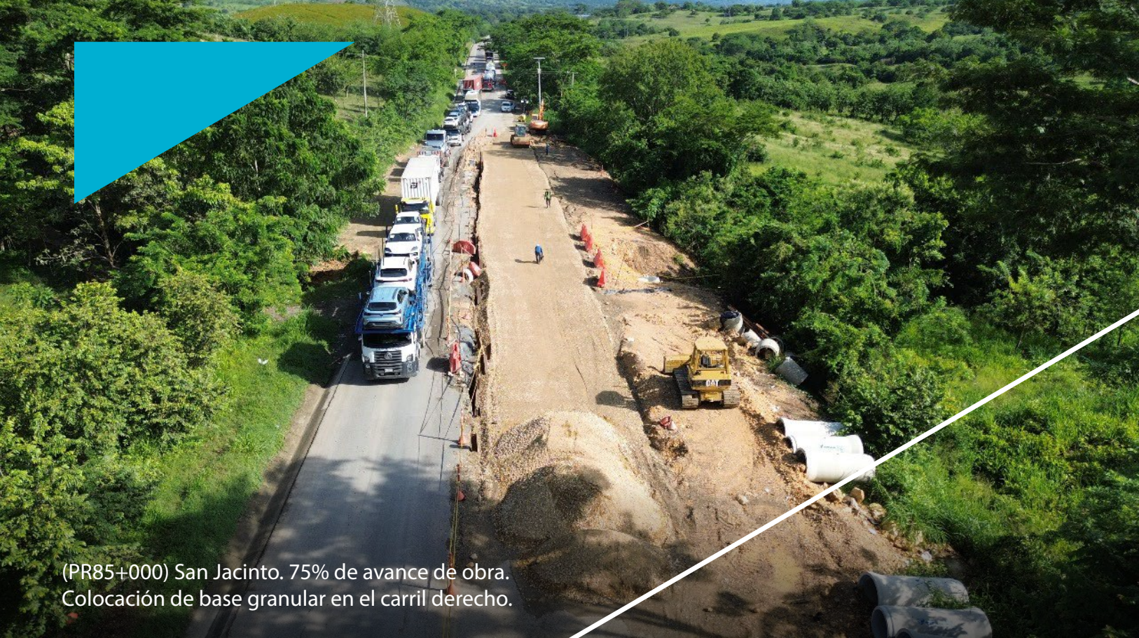
(PR85+000) San Jacinto. 75% de avance de obra. Colocación de base granular en el carril derecho.