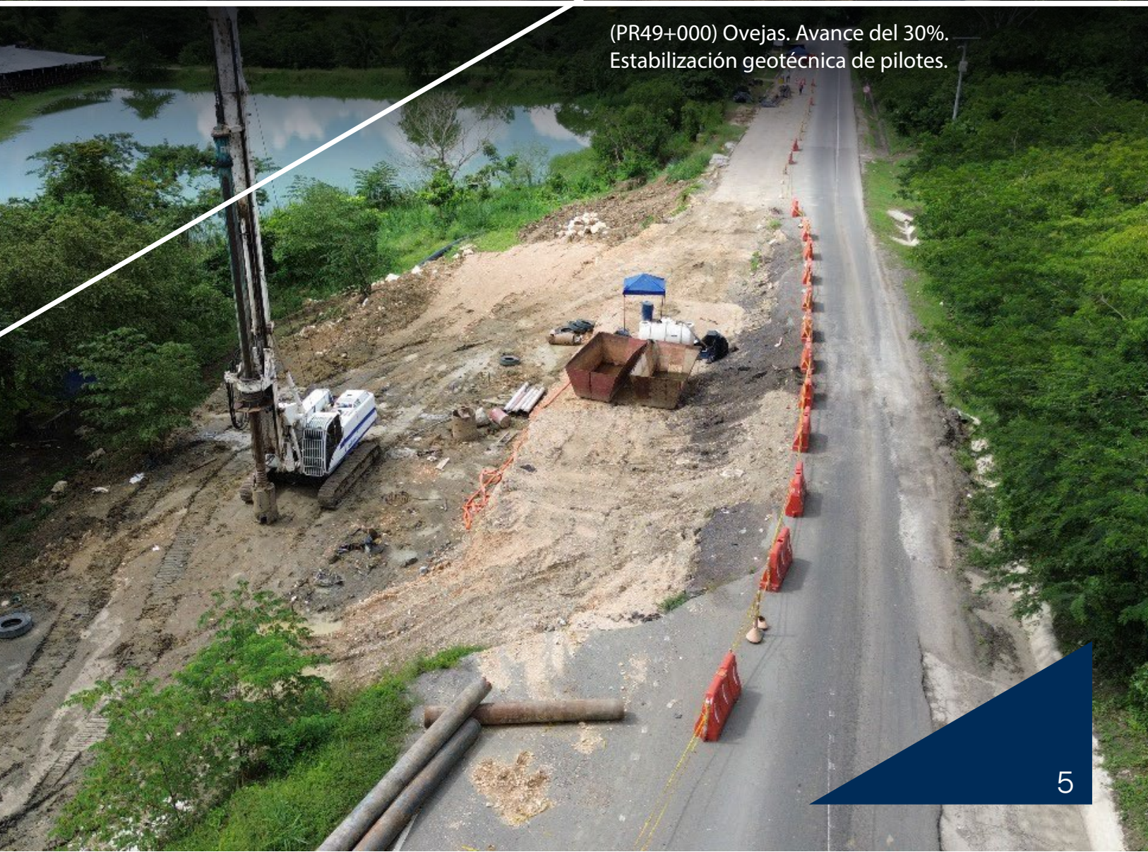
(PR49+000) Ovejas. Avance del 30%. Estabilización geotécnica de pilotes.